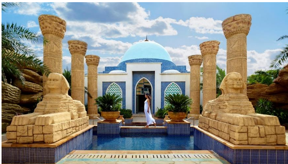
◆ The Legend of Turkish Hammam